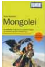
Dumont Reisehandbuch Mongolei Michael Walther, Peter Woeste 2011