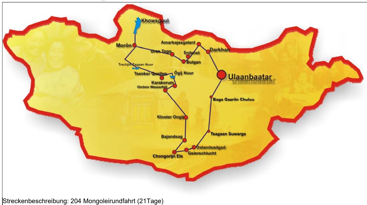
Streckenbeschreibung: 204 Mongoleirundfahrt (21Tage)